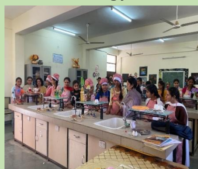
Home Science Lab