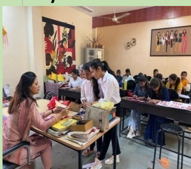
Fashion designing Lab