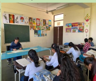
Fine Arts Lab