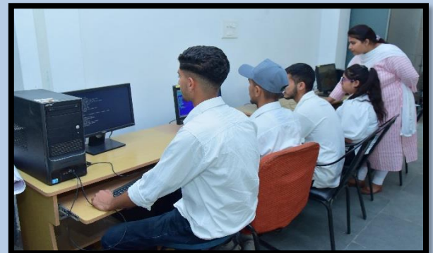
Computer Lab II