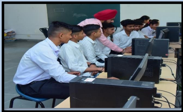
Computer Lab I