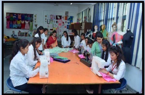
Fashion Designing Lab