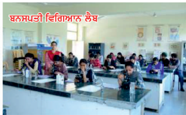
ਬਨਸਪਤੀ ਵਿਗਿਆਨ ਲੈਬ

Education is the most powerful weapon which you can use to change the world. Nelson Mandela