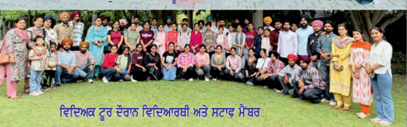
ਵਿਦਿਅਕ ਟੂਰ ਦੌਰਾਨ ਵਿਦਿਆਰਥੀ ਅਤੇ ਸਟਾਫ਼ ਮੈਂਬਰ