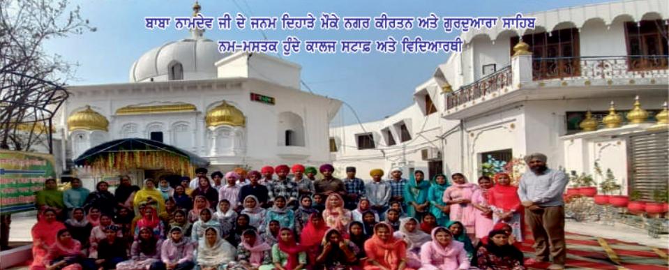
ਬਾਬਾ ਨਾਮਦੇਵ ਜੀ ਦੇ ਜਨਮ ਦਿਹਾੜੇ ਮੌਕੇ ਨਗਰ ਕੀਰਤਨ ਅਤੇ ਗੁਰਦੁਆਰਾ ਸਾਹਿਬ ਨਮ-ਮਸਤਕ ਹੁੰਦੇ ਕਾਲਜ ਸਟਾਫ ਅਤੇ ਵਿਦਿਆਰਥੀ