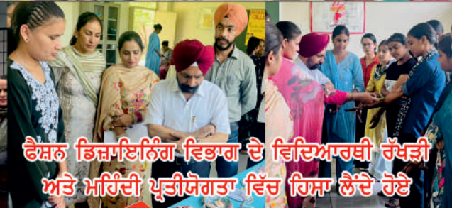
ਫੈਸ਼ਨ ਡਿਜ਼ਾਇਨਿੰਗ ਵਿਭਾਗ ਦੇ ਵਿਦਿਆਰਥੀ ਰੱਖੜੀ ਅਤੇ ਮਹਿੰਦੀ ਪ੍ਰਤੀਯੋਗਤਾ ਵਿੱਚ ਹਿੱਸਾ ਲੈਂਦੇ ਹੋਏ