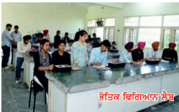
ਭੌਤਿਕ ਵਿਗਿਆਨ ਲੈਬ