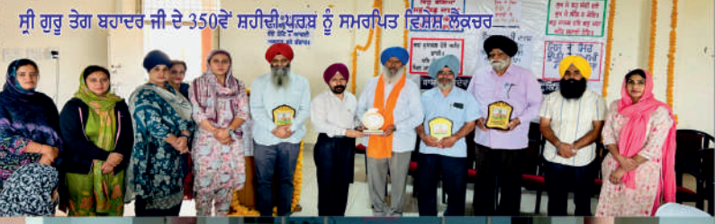
ਸ੍ਰੀ ਗੁਰੂ ਤੇਗ ਬਹਾਦਰ ਜੀ ਦੇ 350ਵੇਂ ਸ਼ਹੀਦੀ ਪੁਰਬ ਨੂੰ ਸਮਰਪਿਤ ਵਿਸ਼ੇਸ਼ ਲੋਕਚਰ