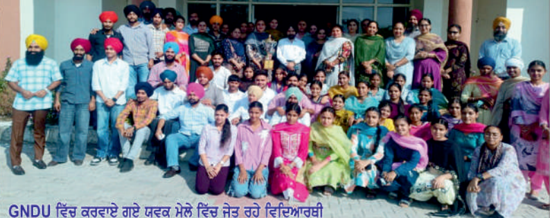
GNDU ਵਿੱਚ ਕਰਵਾਏ ਗਏ ਯੁਵਕ ਮੇਲੇ ਵਿੱਚ ਜੇਤੂ ਰਹੇ ਵਿਦਿਆਰਥੀ