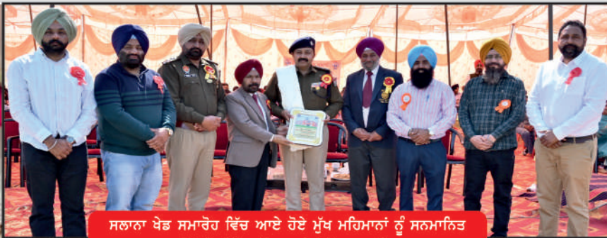
ਸਲਾਨਾ ਖੇਡ ਸਮਾਰੋਹ ਵਿੱਚ ਆਏ ਹੋਏ ਮੁੱਖ ਮਹਿਮਾਨਾਂ ਨੂੰ ਸਨਮਾਨਿਤ ਕਰਦੇ ਹੋਏ ਪ੍ਰਿੰ. ਸਾਹਿਬ ਅਤੇ ਪ੍ਰੋਫੈਸਰ ਸਾਹਿਬਾਨ