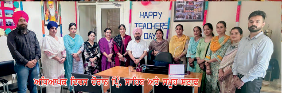
ਅਧਿਆਪਕ ਦਿਵਸ ਦੌਰਾਨ ਪ੍ਰਿੰ. ਸਾਹਿਬ ਅਤੇ ਸਮੂਹ ਸਟਾਫ