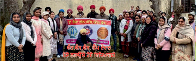
7 ਰੋਜ਼ਾ ਐਨ ਐਸ ਐਸ ਕੈਂਪ ਦੌਰਾਨ ਆਏ ਮੁੱਖ ਮਹਿਮਾਨ ਨੂੰ ਸਨਮਾਨਿਤ ਕਰਦੇ ਹੋਏ ਵਿਦਿਆਰਥੀ