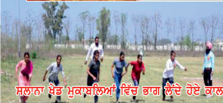
ਸਲਾਨਾ ਖੇਡ ਮੁਕਾਬਲਿਆਂ ਵਿੱਚ ਭਾਗ ਲੈਂਦੇ ਹੋਏ ਕਾਲਜ ਵਿਦਿਆਰਥੀ