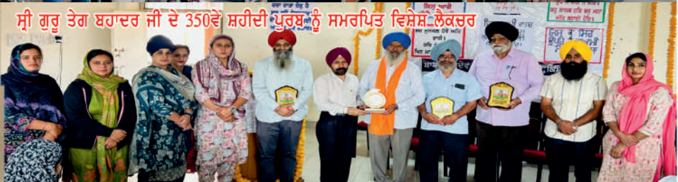
ਸ਼੍ਰੀ ਗੁਰੂ ਤੇਗ ਬਹਾਦਰ ਜੀ ਦੇ 350ਵੇਂ ਸ਼ਹੀਦੀ ਪੂਰਬ ਨੂੰ ਸਮਰਪਿਤ ਵਿਸ਼ੇਸ਼ ਲੈਕਚਰ