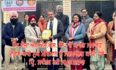
ਸਿੱਖ ਰੋਜ਼ਾ ਐਨ ਐਸ ਐਸ, ਕੈਂਪ ਦੇ ਆਰੰਭ ਸਮੇਂ ਦੌਰਾਨ ਆਏ ਮੁੱਖ ਮਹਿਮਾਨ ਨੂੰ ਸਨਮਾਨਿਤ ਕਰਦੇ ਹੋਏ ਪ੍ਰਿੰ. ਸਾਹਿਬ ਅਤੇ ਸਮੂਹ ਸਟਾਫ਼