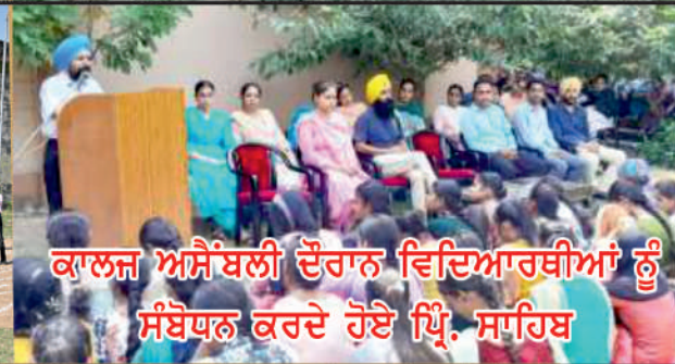
ਕਾਲਜ ਅਸੈਂਬਲੀ ਦੌਰਾਨ ਵਿਦਿਆਰਥੀਆਂ ਨੂੰ ਸੰਬੋਧਨ ਕਰਦੇ ਹੋਏ ਪ੍ਰਿੰ. ਸਾਹਿਬ