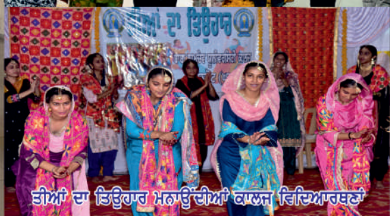
ਤੀਆਂ ਦਾ ਤਿਉਹਾਰ ਮਨਾਉਂਦੀਆਂ ਕਾਲਜ ਵਿਦਿਆਰਥੀ