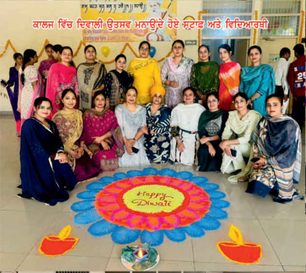
ਕਾਲਜ ਵਿੱਚ ਦਿਵਾਲੀ ਉਤਸਵ ਮਨਾਉਂਦੇ ਹੋਏ ਸਟਾਫ ਅਤੇ ਵਿਦਿਆਰਥੀ