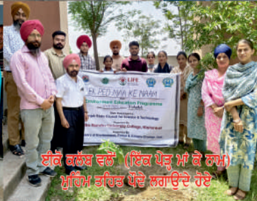
ਈਕੋ ਕਲੱਬ ਵਲੋਂ (ਇਕ ਪੇੜ ਮਾਂ ਕੇ ਲਾਮ) ਮੁਹਿਮ ਤਹਿਤ ਖੋਦੇ ਲਗਾਉਂਦੇ ਹੋਏ