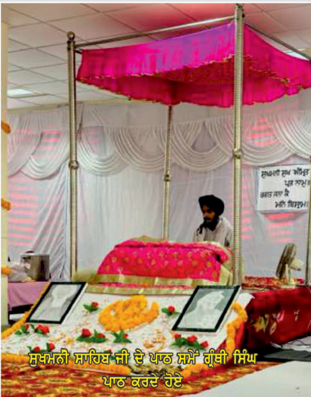
ਸੁਖਮਨੀ ਸਾਹਿਬ ਜੀ ਦੇ ਪਾਠ ਸਮੇਂ ਗ੍ਰੰਥੀ ਸਿੰਘ ਪਾਠ ਕਰਦੇ ਹੋਏ