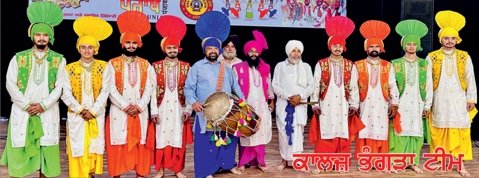
ਕਾਲਜ ਭੰਗੜਾ ਟੀਮ