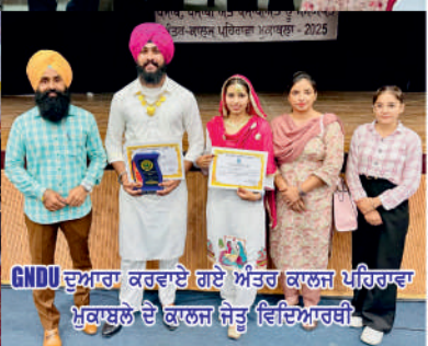
GNDU ਦੁਆਰਾ ਕਰਵਾਏ ਗਏ ਅੰਤਰ ਕਾਲਜ ਪਰਿਹਾਰ ਮੁਕਾਬਲੇ ਦੇ ਕਾਲਜ ਜੇਤੂ ਵਿਦਿਆਰਥੀ