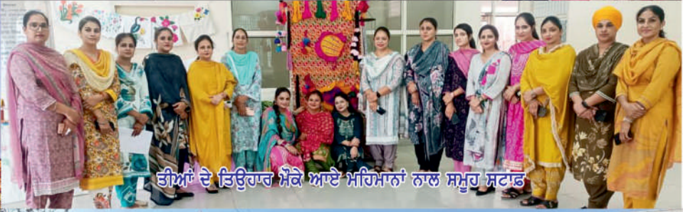
ਤੀਆਂ ਦੇ ਤਿਉਹਾਰ ਮੌਕੇ ਆਏ ਮਹਿਮਾਨਾਂ ਨਾਲ ਸਮੂਹ ਸਟਾਫ