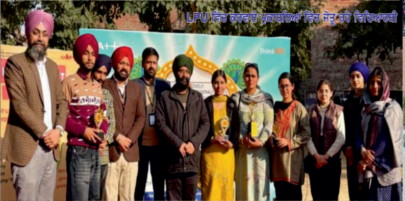
LPU ਵਿੱਚ ਕਰਵਾਏ ਮੁਕਾਬਲਿਆਂ ਵਿੱਚ ਜੇਤੂ ਰਹੇ ਵਿਦਿਆਰਥੀ