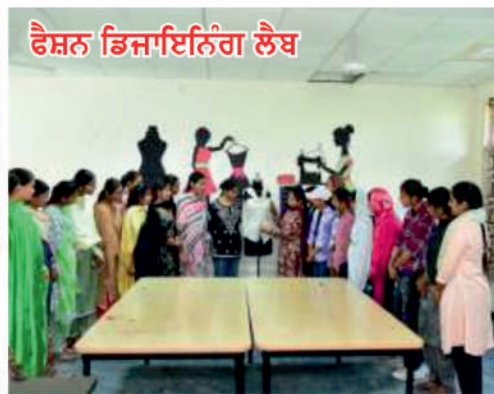
ਫੈਸ਼ਨ ਡਿਜ਼ਾਇਨਿੰਗ ਲੈਬ