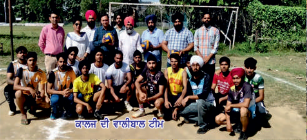
ਕਾਲਜ ਦੀ ਵਾਲੀਬਾਲ ਟੀਮ