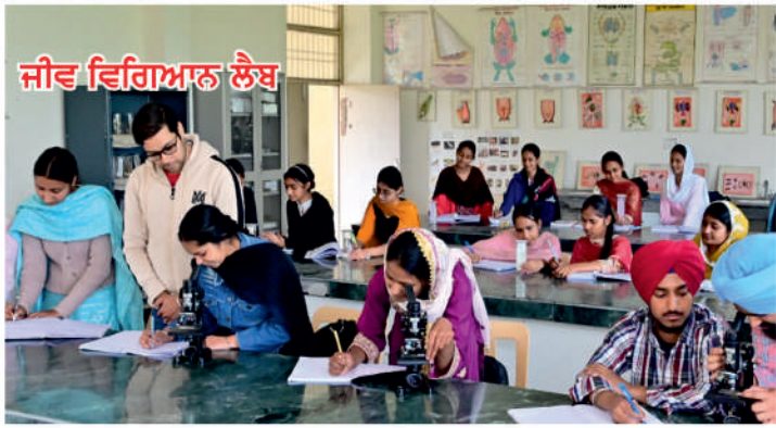
ਜੀਵ ਵਿਗਿਆਨ ਲੈਬ