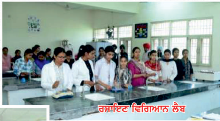
ਰਸਾਇਣ ਵਿਗਿਆਨ ਲੈਬ