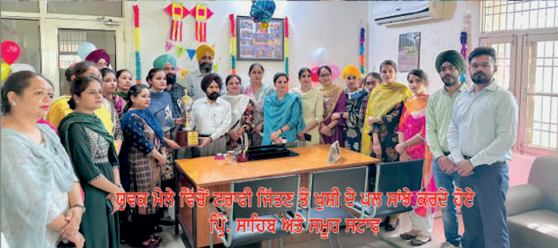
ਯੁਵਕ ਮੇਲੇ ਵਿੱਚੋਂ ਟਰਾਰੀ ਜਿੱਤਣ ਤੋਂ ਖੁਸ਼ੀ ਦੇ ਖਲ ਸਾਝੇ ਕਰਦੇ ਹੋਏ ਪ੍ਰਿੰ. ਸਾਹਿਬ ਅਤੇ ਸਮੂਹ ਸਟਾਫ਼