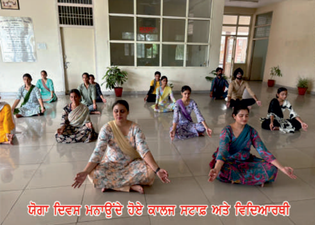
ਯੋਗਾ ਦਿਵਸ ਮਨਾਉਂਦੇ ਹੋਏ ਕਾਲਜ ਸਟਾਫ ਅਤੇ ਵਿਦਿਆਰਥੀ