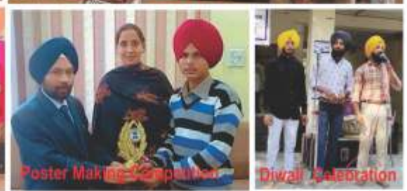
Poster Making Competition