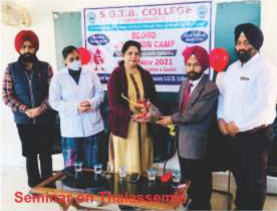
Seminar on Thalassemia