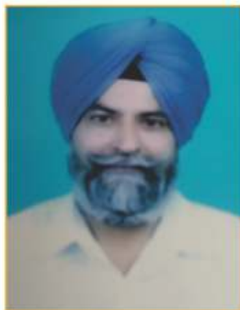
Prof. Dalbir Singh Malhi Govt. College