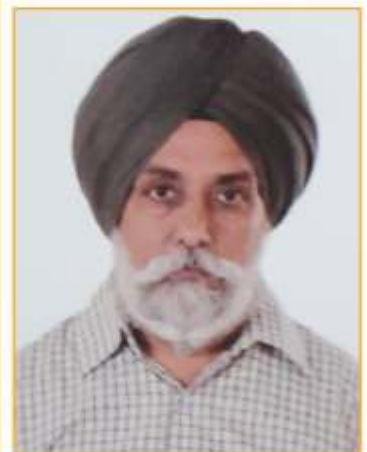
Prof. Joginder Singh Malhi Govt. College