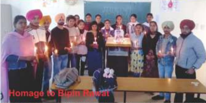
Homage to Bipin Rawat