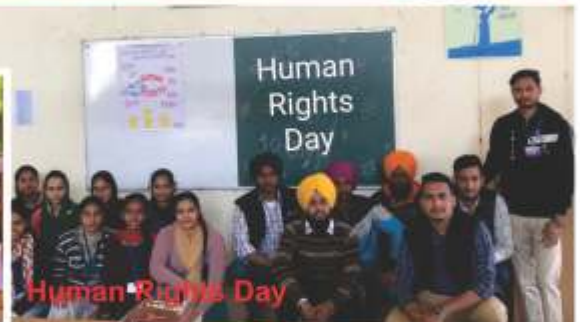
Human Rights Day