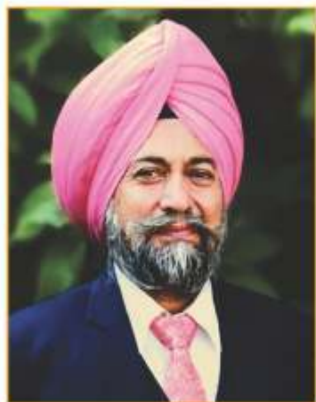
Prof. Nirmal Singh Govt. College