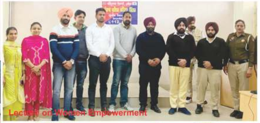
Lecture on Women Empowerment